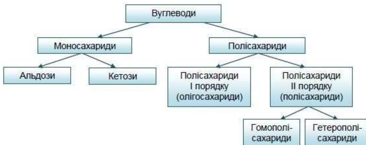
Рисунок 6.1 – Класифікація вуглеводів

Вуглеводи поділяють на три основні групи: моносахариди, олігосахариди і полісахариди (рисунок 6.1).